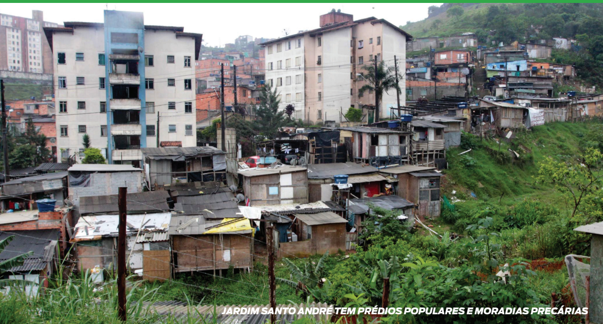
JARDIM SANTO ANDRÉ TEM PRÉDIOS POPULARES E MORADIAS PRECÁRIAS

Santo André é uma cidade plural, com características sociais, culturais e econômicas diversas. Além disso, o município tem peculiaridades geográficas com desafios específicos que necessitam de um olhar particular para sua compreensão.