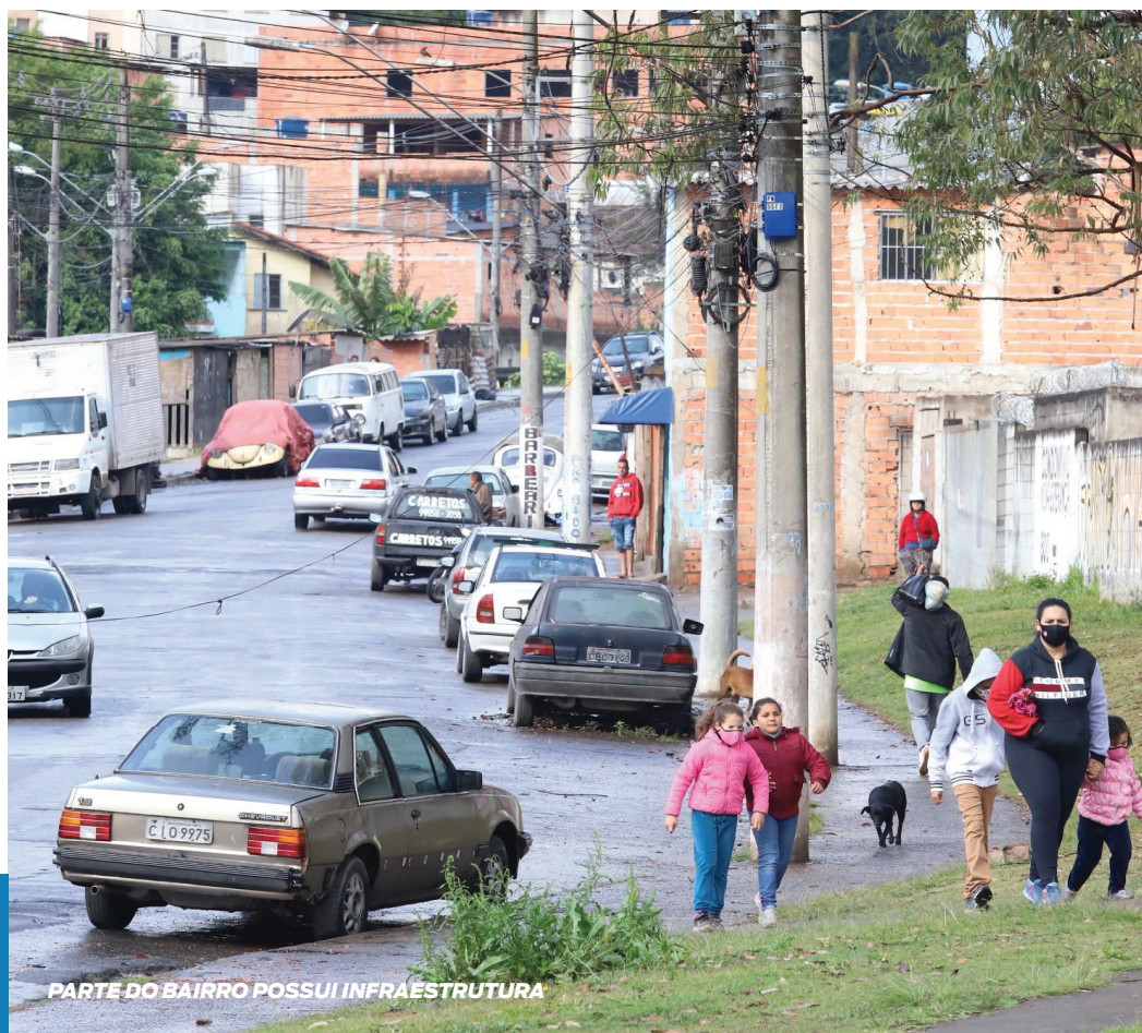
PARTE DO BAIRRO POSSUI INFRAESTRUTURA

Aponte a câmera do seu celular e saiba como participar do debate sobre o futuro de Santo André