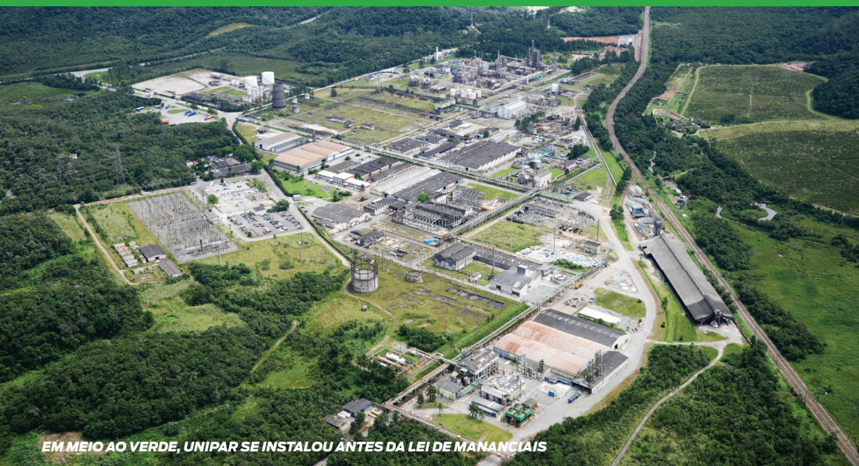
EM MEIO AO VERDE, UNIPAR SE INSTALOU ANTES DA LEI DE MANANCIAIS

Santo André é uma cidade plural, com características sociais, culturais e econômicas diversas. Além disso, o município tem peculiaridades geográficas com desafios específicos que necessitam de um olhar particular para sua compreensão.