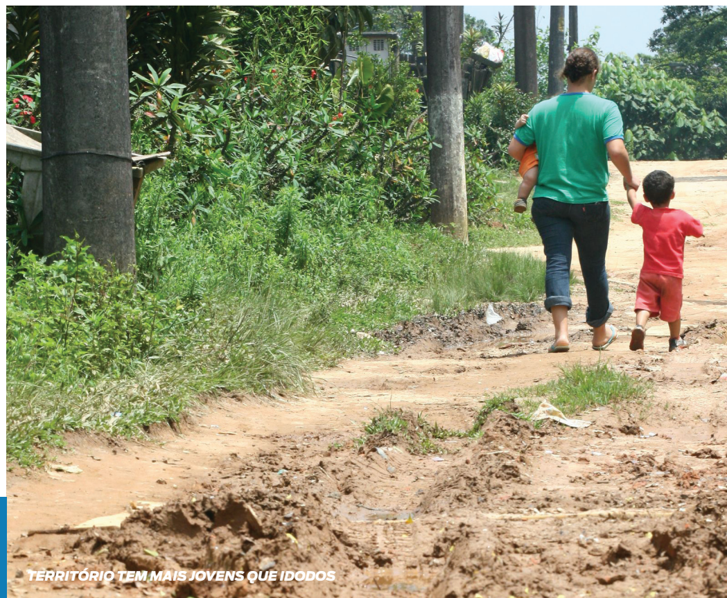
TERRITÓRIO TEM MAIS JOVENS QUE IDOSOS

(15,8%) 0 a 9 anos (16,1%) 10 a 19 anos (13,5%) 20 a 29 anos (15,1%) 30 a 39 anos (15,3%) 40 a 49 anos (12,3%) 50 a 59 anos (7,7%) 60 a 69 anos (4,2%) 70 anos e mais