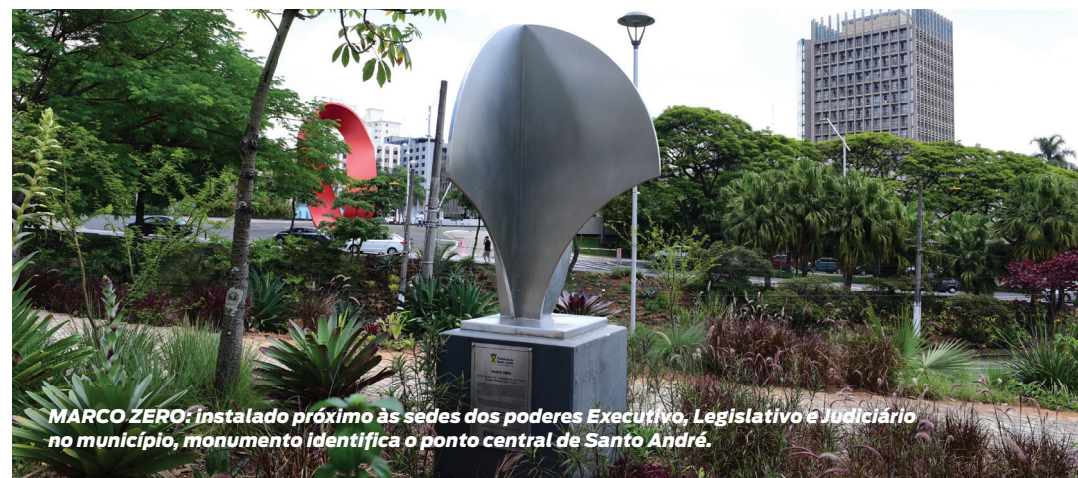
MARCO ZERO: instalado próximo às sedes dos poderes Executivo, Legislativo e Judiciário no município, monumento identifica o ponto central de Santo André.