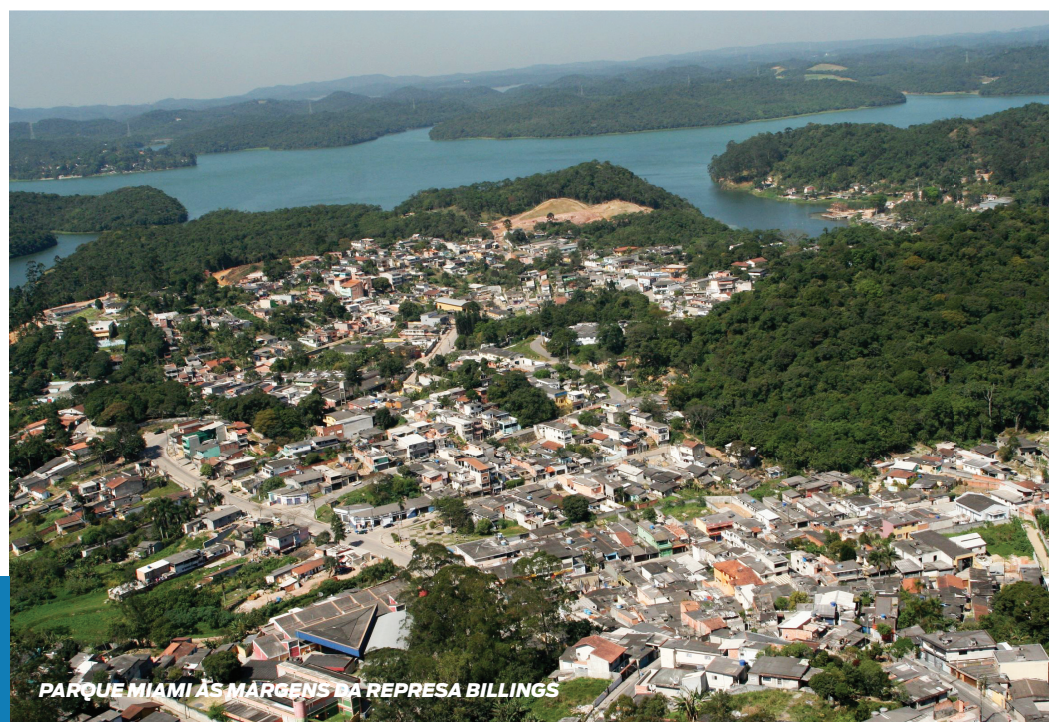
PARQUE MIAMI ÀS MARGENS DA REPRESA BILLINGS

Aponte a câmera do seu celular e saiba como participar do debate sobre o futuro de Santo André