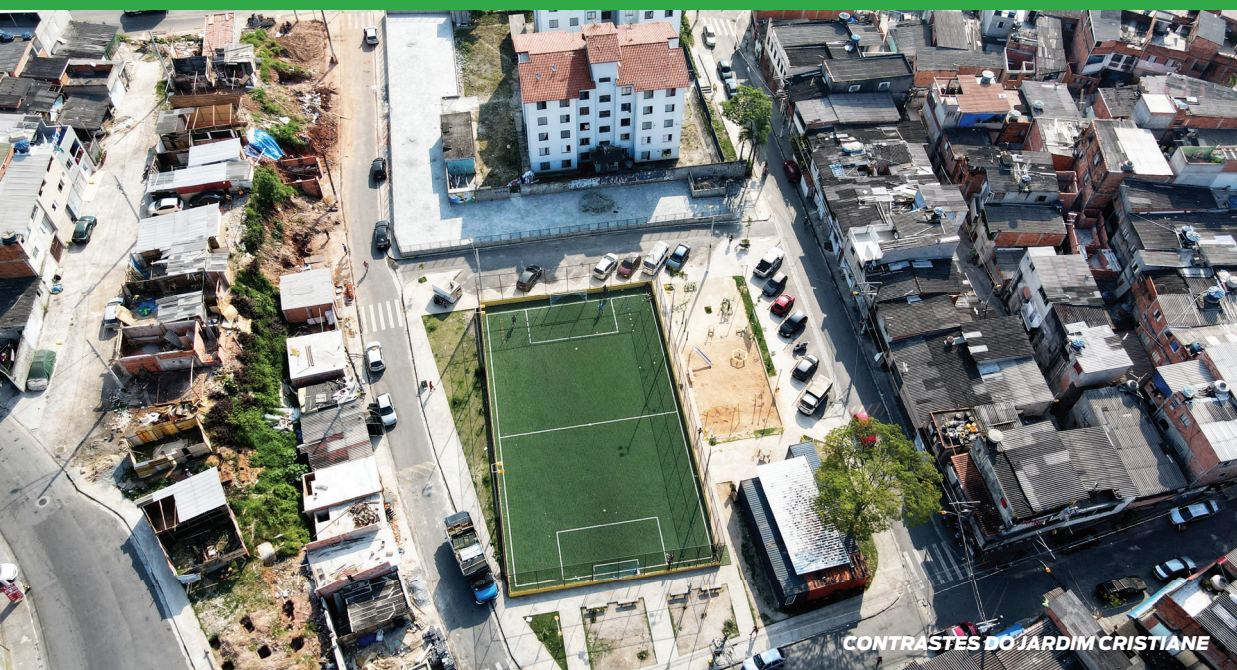
CONTRASTES DO JARDIM CRISTIANE

Santo André é uma cidade plural, com características sociais, culturais e econômicas diversas. Além disso, o município tem peculiaridades geográficas com desafios específicos que necessitam de um olhar particular para sua compreensão.