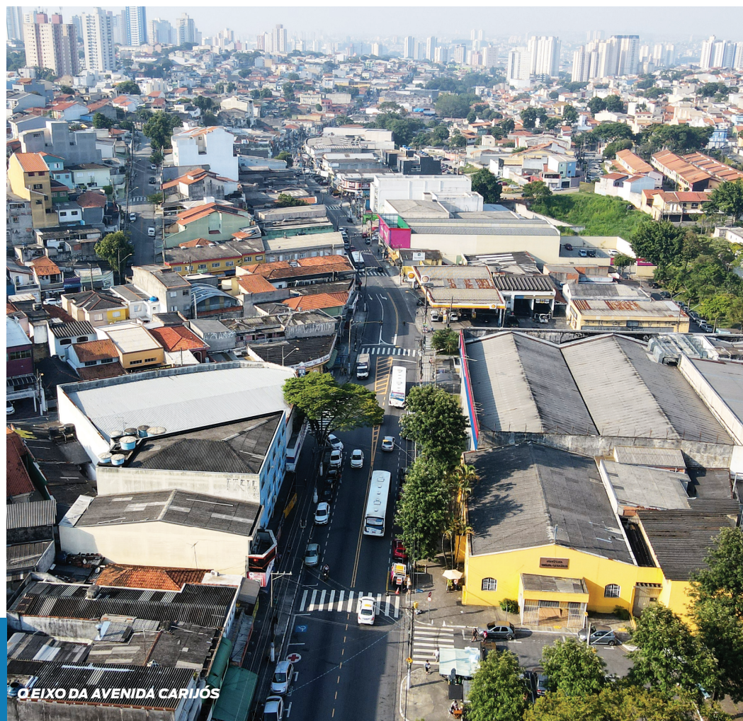
O EIXO DA AVENIDA CARIJÓS

Aponte a câmera do seu celular e saiba como participar do debate sobre o futuro de Santo André