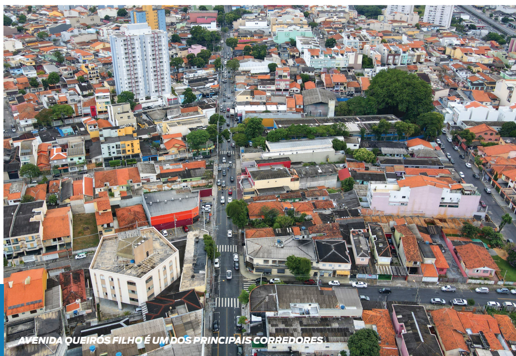
AVENIDA QUEIRÓS FILHO É UM DOS PRINCIPAIS CORREDORES

Aponte a câmera do seu celular e saiba como participar do debate sobre o futuro de Santo André