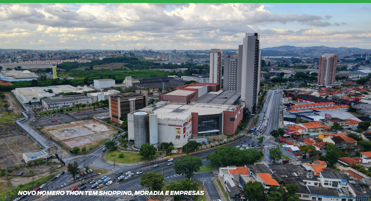
NOVO HOMERO THON TEM SHOPPING, MORADIA E EMPRESAS

Santo André é uma cidade plural, com características sociais, culturais e econômicas diversas. Além disso, o município tem peculiaridades geográficas com desafios específicos que necessitam de um olhar particular para sua compreensão.